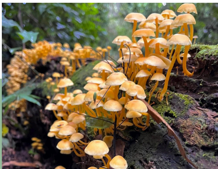
Cogumelos crescendo em tronco em decomposição na floresta.

Aqui temos a chance de admirar a expressão artística dos nossos colegas.